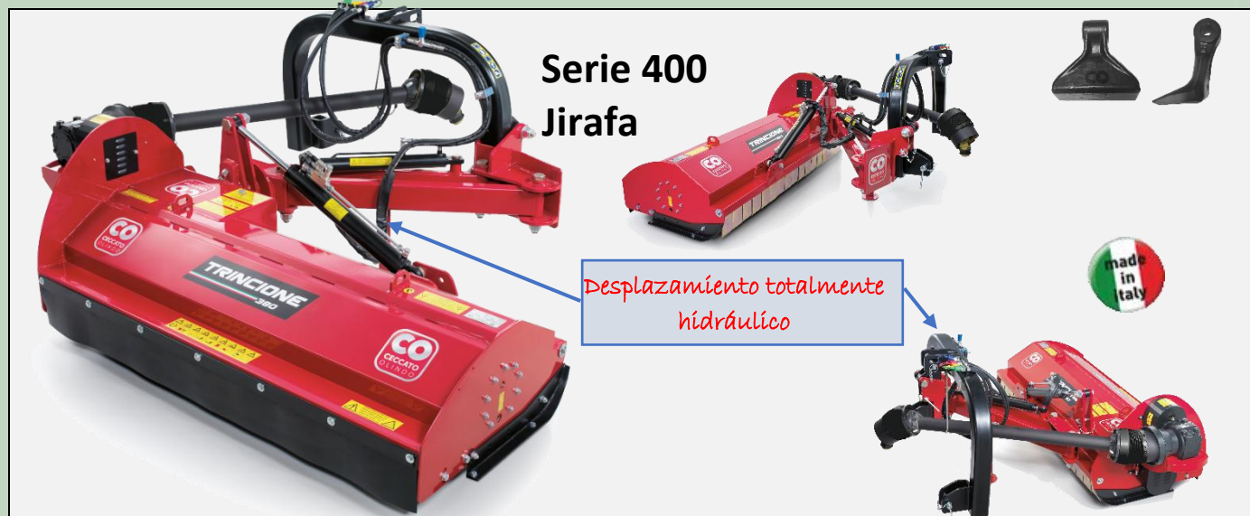
Serie 400 Jirafa